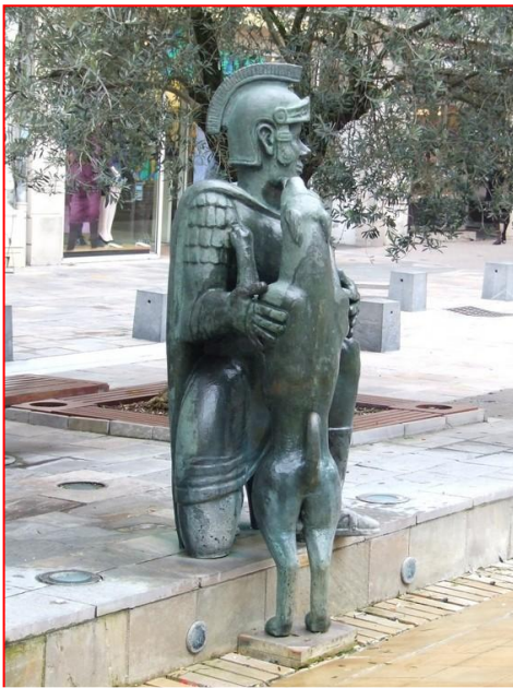
Dax : Le légionnaire romain et son chien