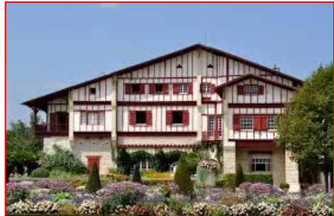
Cambo les Bains : maison d'Edmond Rostand